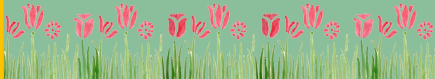
Illustration nach Emanuel von Seidl