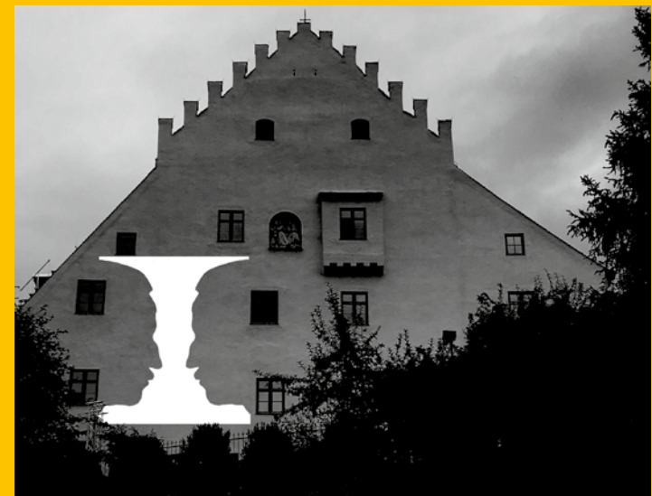
Entwurf für Wandprojektion, Ugo Dossi

Präsentation des Projekt-Katalogs Begehung der Projektion Westwand Schloss